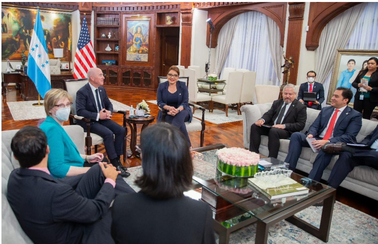
Foto: Presidenta Xiomara Castro se reúne con el Secretario de Seguridad Nacional de Estados Unidos, Alejandro N. Mayorkas, durante su visita a Honduras los días 26 y 27 de julio de 2022.

intervenciones de EE.UU. en los asuntos internos de Honduras. A continuación, el informe detalla tres intervenciones importantes relacionadas con reformas o cambios políticos propuestos e implementados por el Presidente Castro: la Ley de Reforma Energética, la Ley de Empleo por Hora y la Ley ZEDE. Por último, esboza algunas "peculiaridades" del intervencionismo estadounidense durante momentos legislativos y políticos claves en el año 2022, así como declaraciones públicas estadounidenses inapropiadas. Este documento se actualizará periódicamente (semestral o anualmente) a lo largo de los cuatro años de Presidencia de Xiomara Castro.